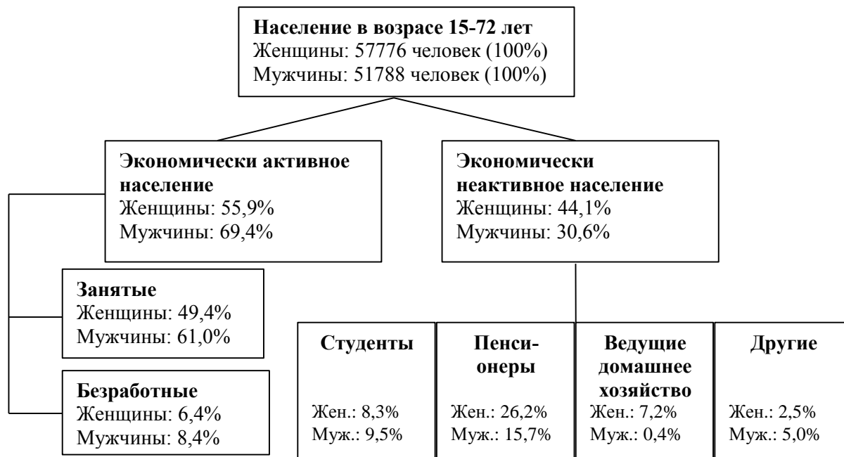
Рис. 1. Распределение населения в возрасте 15 - 17 лет по экономической активности в 1997 г.